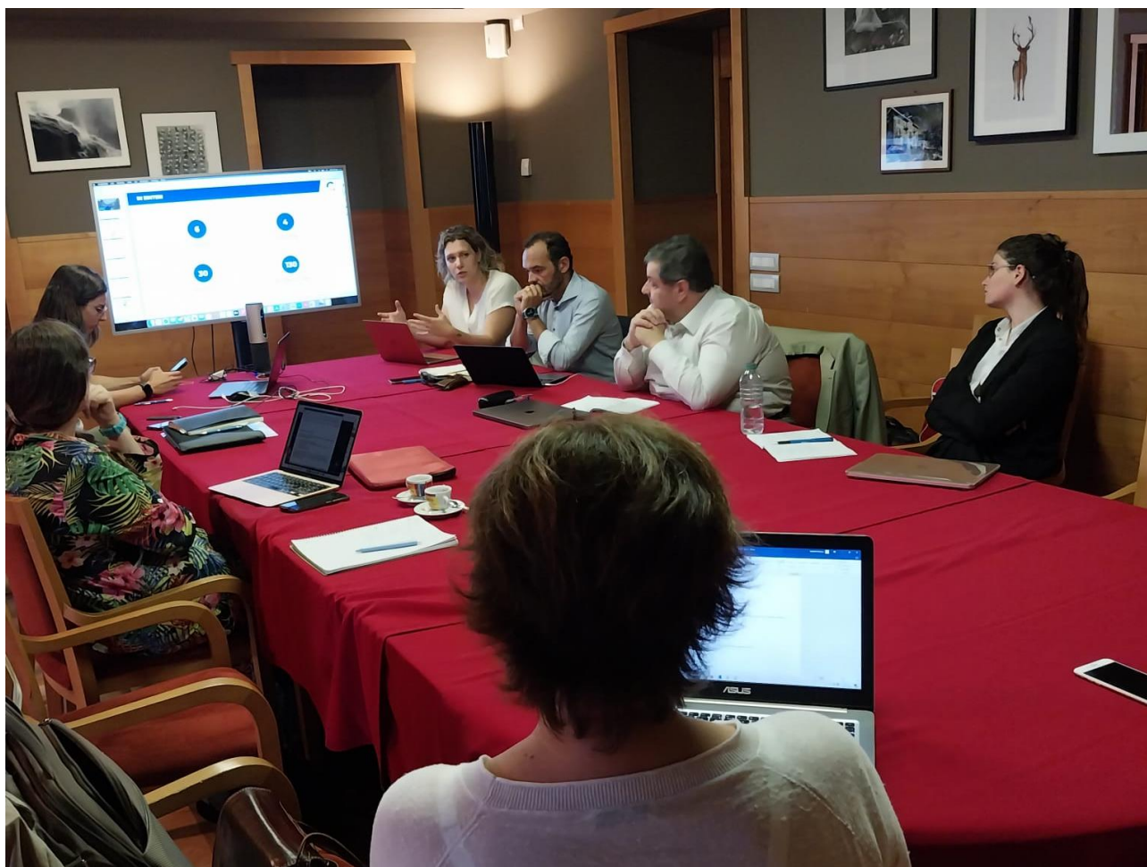
Figura 3 - Incontro con CISA Consulting a Chiesa di Valmenenco.