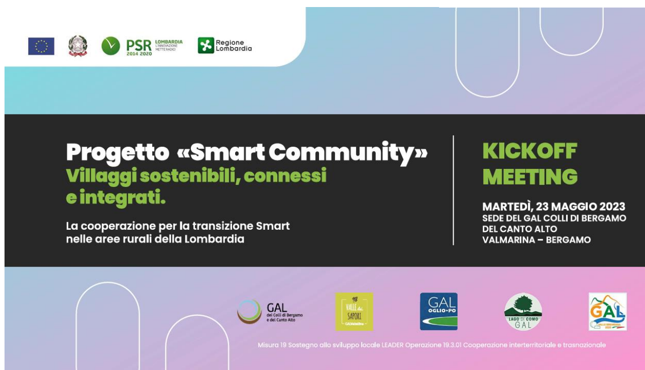
Figura 2 - Slide di presentazione Kick-Off Meeting