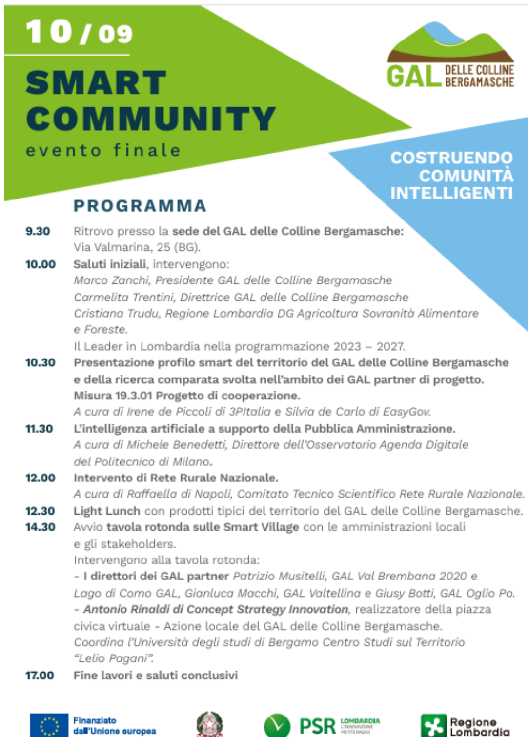
Figura 5 - Locandina Evento Finale Smart Community.

Via Valmarina, 25 – 24123 Bergamo (Bg). Codice fiscale: 04240740169. PEC: galcollinebergamasche@pec.buffetti.it . Tel. 035 573185 Capitale sociale sottoscritto Euro 21.900, parte versata Euro 21.900 Registro Imprese n° 04240740169 – R.E.A. n° 447263 – Ufficio di BERGAMO