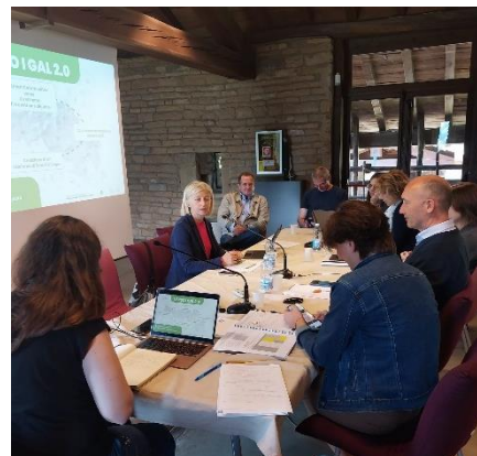
Figura 1 - Kick off meeting

Il 23 Maggio 2023 presso la sede del GAL delle Colline Bergamasche in Valmarina a Bergamo è stato organizzato il KICKOFF MEETING del progetto che vede l'avvio di un percorso per la transizione smart delle cinque aree rurali che hanno partecipato al progetto: Gal Colline bergamasche (Ex Gal Colli di Bergamo e del Canto Alto), Gal Val Brembana 2020, Gal Valtellina, Gal Oglio Po, Lago di Como Gal. (Allegato 1)